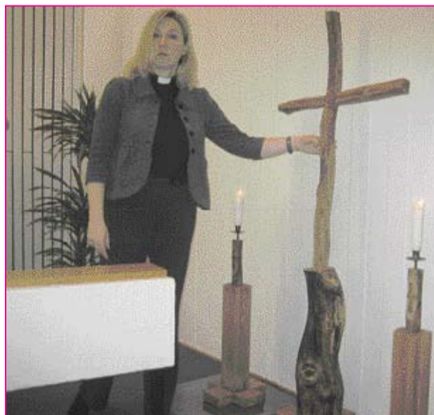
Seurakuntalaisen omenapuusta tekemä risti.

Jumalanpalvelus joka sunnuntai ja kirkollisina juhlapyhinä klo 12.