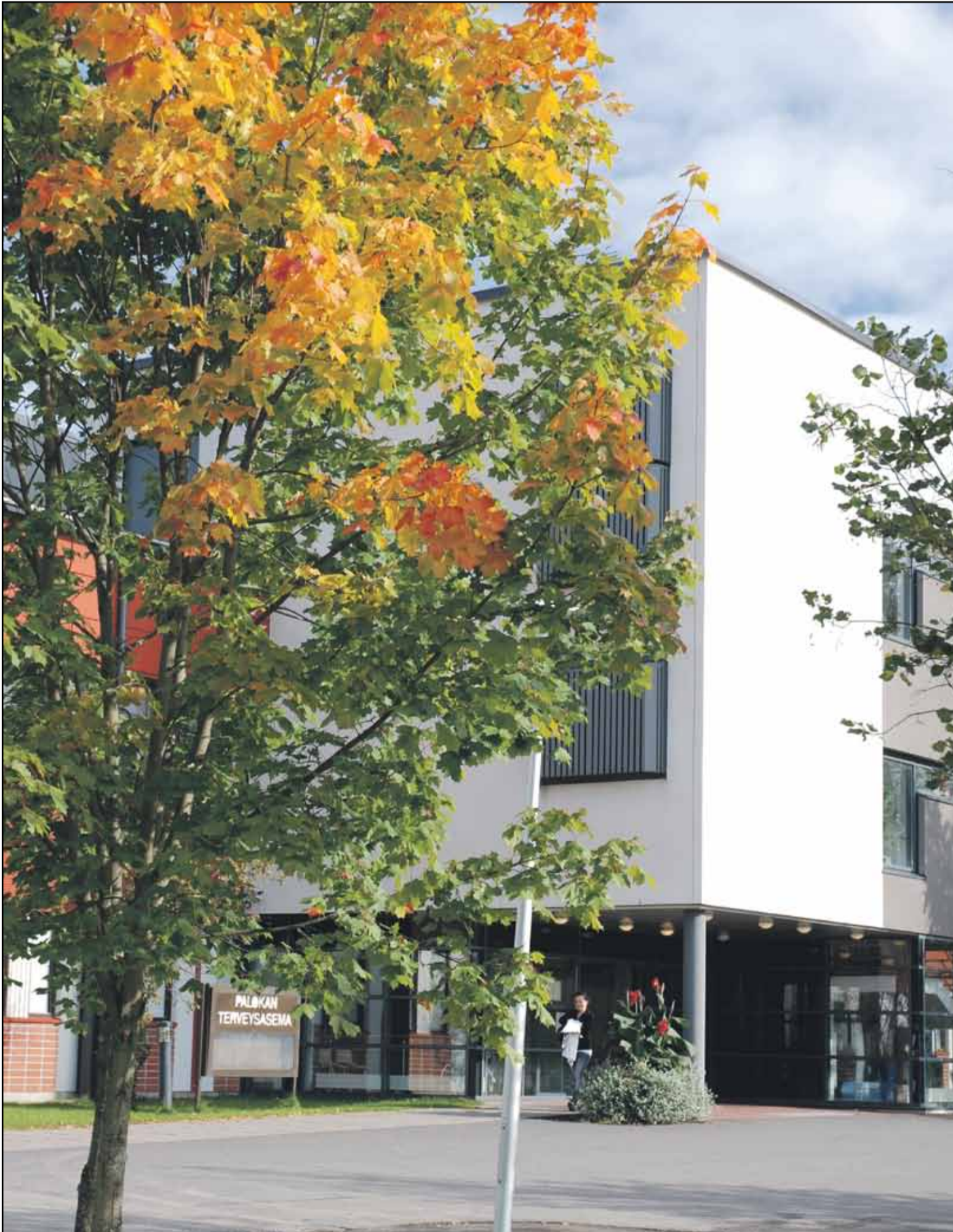
Palokan terveysasema siirtyy kaupungille vuoden vaihteessa. Se tulee saamaan uusia asiakkaita lähiseudun kaupunkilaisista. Mutta keitä uudet asiakkaat ovat ja mitä palveluja he tulevat saamaan, selviää aikaisintaan kesällä 2011.