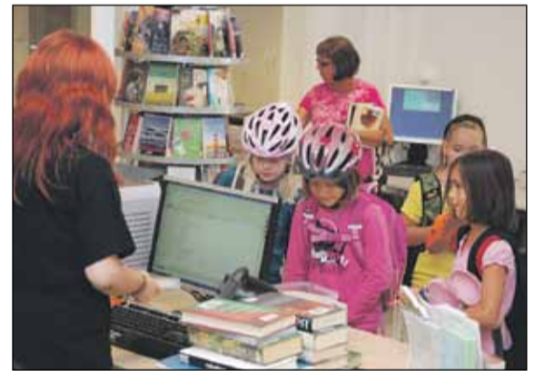
Lähikirjastot edelleen vaarassa