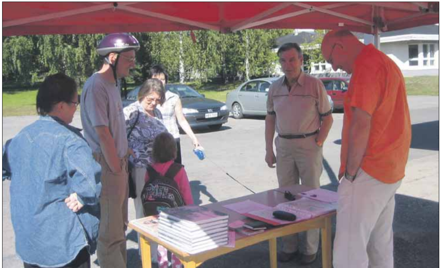
Lohikoskelaiset olivat ahkeria allekirjoittajia.