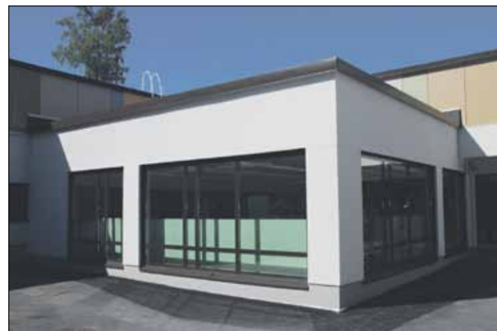
Näillä näkymin Lohikosken uusi pienkirjasto säilyy.