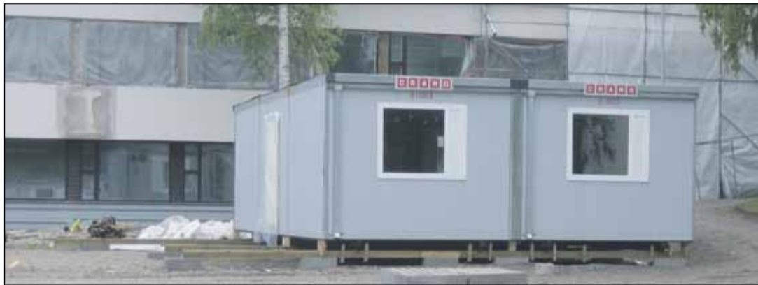
Tätä parakkia ei kaupunki jättänyt nuorisotilaksi koulun pihaan.

Päätoimittaja Raimo Rajanen 045 6798 234