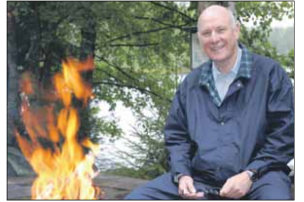
Kiireinen mies avaa päiväkirjansa