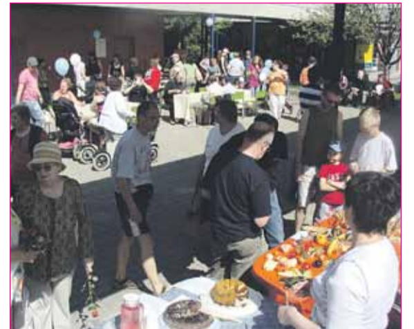
Huhtasuolla osataan nauttia kesästä